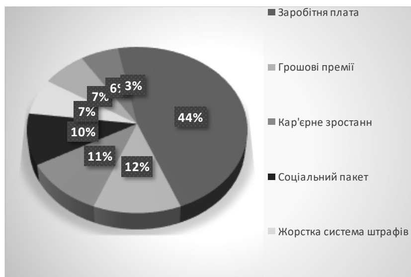
Рис. 1.2. Результати опитування працівників різних підприємств щодо їх ставлення до різних методів мотивації, %